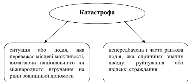
Рис. 2 Визначення катастрофи згідно з Міжнародною базою даних катастроф (EM-DAT)